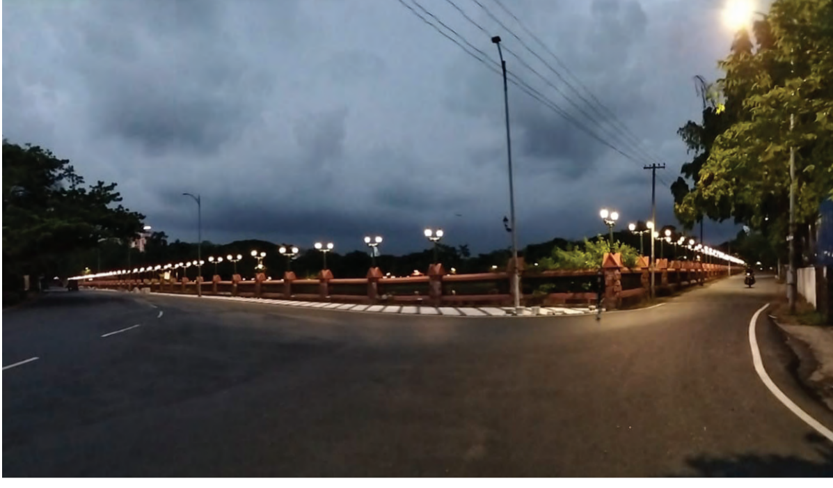
ലോക്ക്ഡൗണിനെ തുടർന്ന് വീടനുമായ മാന്വില മൈതാനം. മഴമേഘങ്ങളുടെ പശ്ചാത്തലത്തിൽ

തേങ്ങപ്പുലം: കൊവിഡ് വ്യാപനത്തിന്റെ പശ്ചാത്തലത്തിൽ ആവശ്യ സർവീസായി തുറന്ന പ്രവർത്തിക്കുന്ന കടകളുടെ സമയ പരിധി ചുരുക്കിയത് പുന്ന: പരിശോധിക്കണമെന്ന് വള്ളിക്കുന്ന് എം.എൽ.എ മുഖ്യമന്ത്രിയോടാവശ്യപ്പെട്ടു. നിലവിൽ വരെയുണ്ടാകാൻ പറ്റാത്ത തുറന്ന പ്രവർത്തിക്കാനുള്ള അനുമാനം.